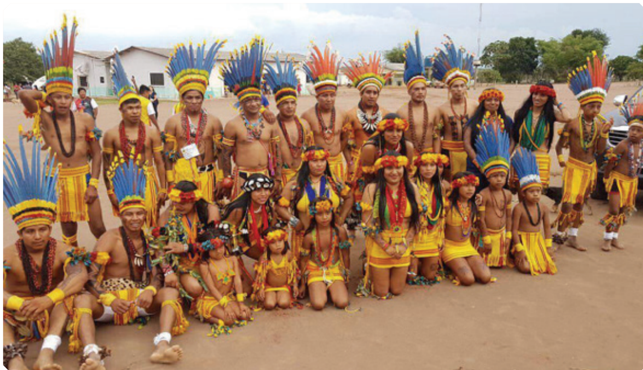
Parte do povo Haliti Paresi em dia de festa tradicional.

A diversidade pode ser considerada um dos mais valiosos patrimônios humanos. As diferentes concepções de mundo, línguas e expressões artísticas enriquecem a cultura e prosperam a tolerância.