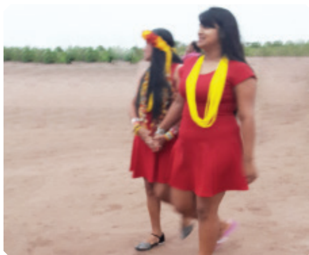
Família apresentando a filha à comunidade no dia da festa da menina-moça.

A festa da menina-moça ocorre quando uma garota da aldeia tem a primeira menarca. Quando isso acontece, a menina primeiramente é levada para uma oca menor construída dentro da hati (casa tradicional) e lá ela permanece por 30 dias recebendo banhos especiais e conselhos de sua mãe e avó. Os demais moradores da aldeia ficam sem contato com a menina durante esse período. Quando o ritual é concluído, a família da moça oferece uma festa apresentando-a à comunidade, sinalizando que a menina já está pronta para compromissos mais sérios, como o casamento. Para os garotos não há nenhum ritual de passagem da infância para a adolescência.