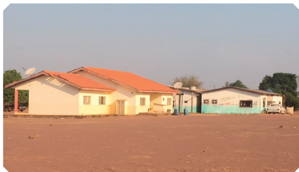
Escolas localizadas na Aldeia Rio Verde.

O espaço escolar da comunidade Haliti Paresi , na aldeia Rio Verde, apresenta inúmeras circunstâncias e acontecimentos que levam a discussões no que se refere à cidadania, à construção da identidade, e ao respeito à diversidade cultural. Lá existem duas escolas (uma estadual e uma municipal). A Escola Estadual Indígena de educação Básica Malamalali atende aos alunos do Ensino Médio. A Escola Municipal Indígena Zozoiteiro também tem seu prédio na mesma aldeia, ao lado da escola estadual e atende ao Ensino Fundamental do Pré ao 9º ano.