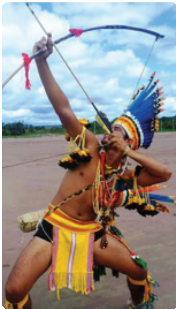
Exemplo de arco e flecha.

Nessa modalidade não há um limite máximo de participantes. Os jogadores se posicionam lado a lado em fila e devem atirar a flecha o mais distante possível. A flecha que atingir a maior distância vencerá a rodada.