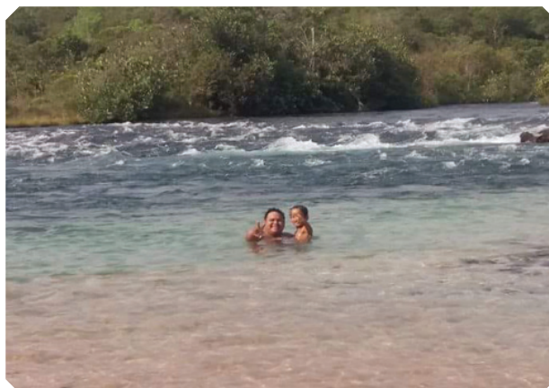
Rio Verde, localizado dentro da Aldeia Rio Verde, no Município de Tangará da Serra, MT.