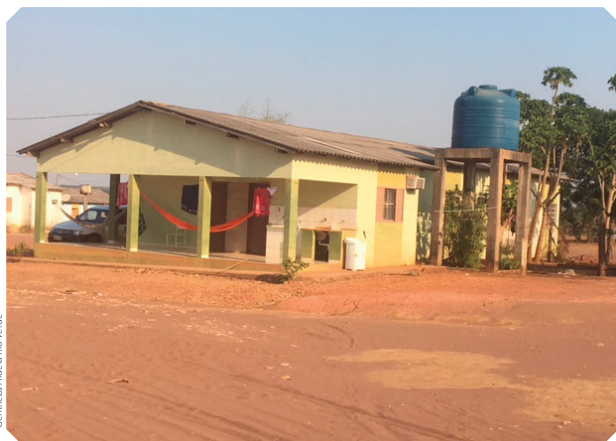
Gemiliza Aldeia Rio Verde

por exemplo: energia elétrica em todas as casas; duas escolas (uma estadual e outra municipal) inseridas no contexto de educação escolar indígena; posto de saúde; poço artesiano; e trator para limpeza e coleta de lixo. Há também carros disponíveis para o atendimento das famílias quando necessitam se deslocar para as cidades próximas em busca de algum atendimento especial. Em virtude da grande extensão de terra das áreas indígenas Pareci (cerca de 1.500.000 ha.), existem outros dois polos de saúde, que se localizam nas aldeias Bacaval (Campo Novo do Parecis) e Três Lagoas (Conquista do Oeste – Terra indígena juininha), oferecendo os mesmos atendimentos que o posto da Aldeia Rio Verde.