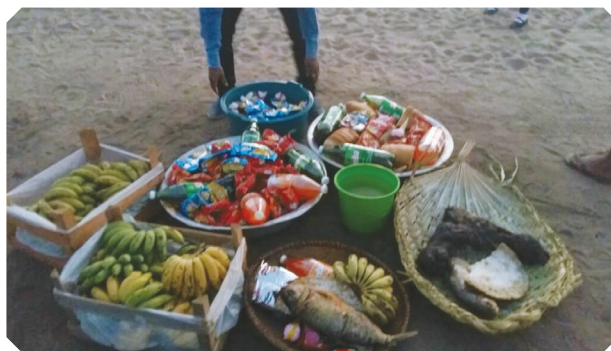
Alimentos que serão oferecidos ao deus Enoré em agradecimento pela colheita.

A festa da colheita geralmente é realizada após o resultado que se obtém das roças tradicionais. Tudo o que foi produzido é ofertado primeiramente ao deus Enoré e depois é repartido entre a comunidade. Nessa festa, a celebração é feita com danças e cantos profêricos pelos homens.