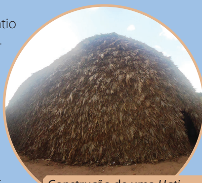
Construção de uma Hati finalizada.

A maioria das aldeias segue o formato circular ou oval com um grande pátio no centro, que serve como local para as grandes reuniões, esportes e comemorações das festas tradicionais. A maioria das moradias se configura no estilo das hati , também conhecidas como casas tradicionais. A arquitetura dos casões é impressionante, chegando a medir mais de 5 metros de altura. A armação oval é toda feita em madeira retirada da natureza pelos moradores locais. Depois que a armação fica pronta, colocam-se as folhas de guariroba ou buriti. A construção da hati leva em torno de 30 dias com mais ou menos 2 a 3 homens trabalhando. Cada casão tem duas aberturas, uma voltada para o nascer do sol e a outra para o pôr do sol.