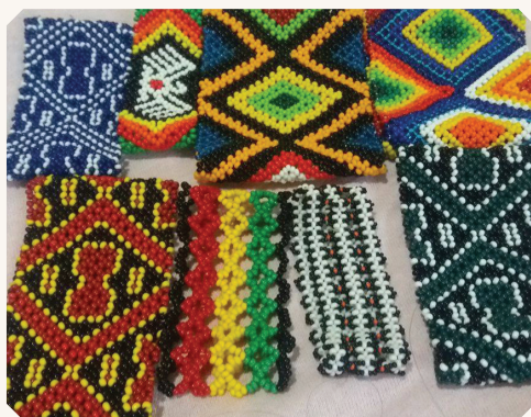
Adornos típicos da etnia Paresi.

As pinturas são usadas no corpo e também na decoração dos objetos confeccionados pelos indígenas. Geralmente são feitas pelas mulheres. Para cada ocasião se faz uma pintura diferente. Cada etnia possui diferentes grafismos que os diferem uns dos outros.