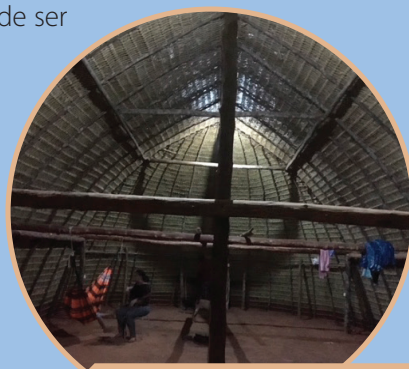
Interior de uma Hati ainda sem mobílias.

O chão dos casões é feito de solo batido, onde são colocados todos os móveis que compõem uma casa. Não há paredes que dividem os cômodos dos casões. Para alguns móveis, como guarda-roupa e fogão, coloca-se uma armação de madeira para proteger do solo. Além dos móveis, existem muitas redes penduradas nas armações de madeira. Elas servem para descansar e também para dormir.