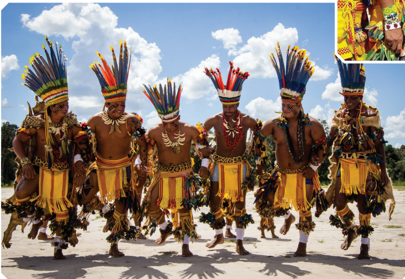
Trajes típicos e adornos usados pelo povo Haliti Paresi .

Os homens e meninos geralmente usam um cocar para adornar a cabeça, o qual é feito de penas de aves (arara, especialmente), uma tanga ( zahitse ), colares e pinturas na maior parte do corpo.