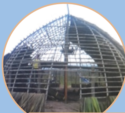
Construção de uma Hati (casa tradicional).

A maioria das aldeias segue o formato circular ou oval com um grande pátio no centro, que serve como local para as grandes reuniões, esportes e comemorações das festas tradicionais. A maioria das moradias se configura no estilo das hati , também conhecidas como casas tradicionais. A arquitetura dos casões é impressionante, chegando a medir mais de 5 metros de altura. A armação oval é toda feita em madeira retirada da natureza pelos moradores locais. Depois que a armação fica pronta, colocam-se as folhas de guariroba ou buriti. A construção da hati leva em torno de 30 dias com mais ou menos 2 a 3 homens trabalhando. Cada casão tem duas aberturas, uma voltada para o nascer do sol e a outra para o pôr do sol.