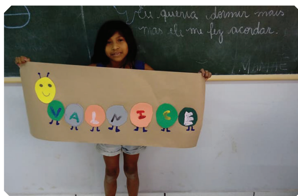
Alunos e professoras em atividade escolar.