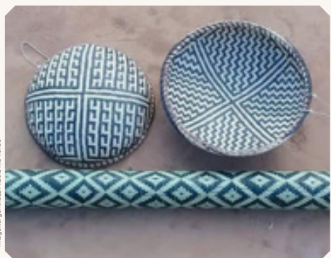
Artesanatos típicos do etnia Paresi.