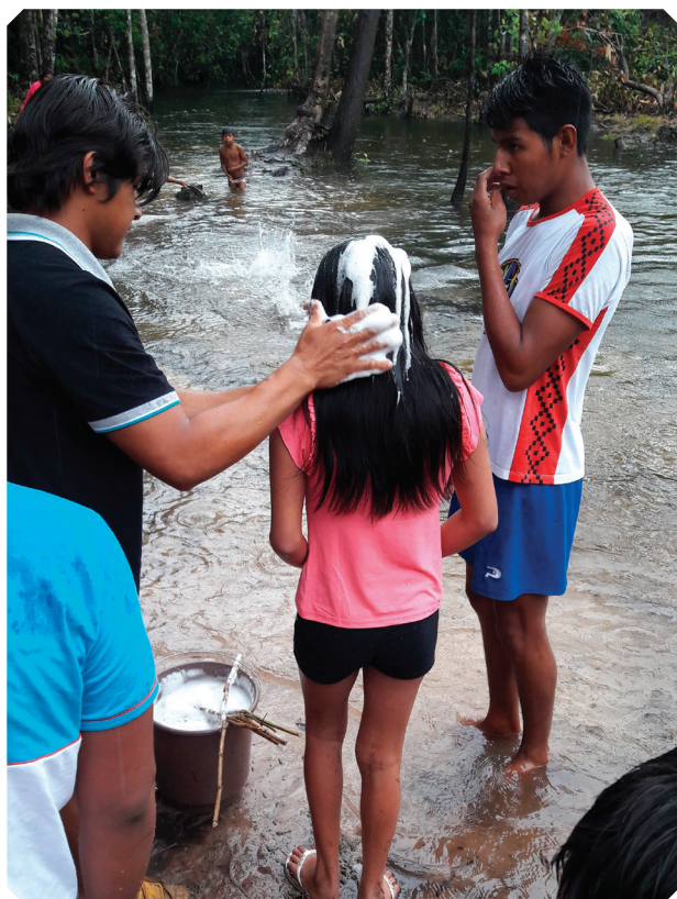
Criança sendo batizada. Nesse ritual, ela recebe o nome indígena.

A criança é levada ao rio, onde recebe uma “bênção” do líder espiritual da aldeia, conhecido como pajé . Para cada membro da aldeia é escolhido um nome diferente, mesmo que a pessoa seja da mesma família. Os nomes são escolhidos baseados em elementos da natureza.