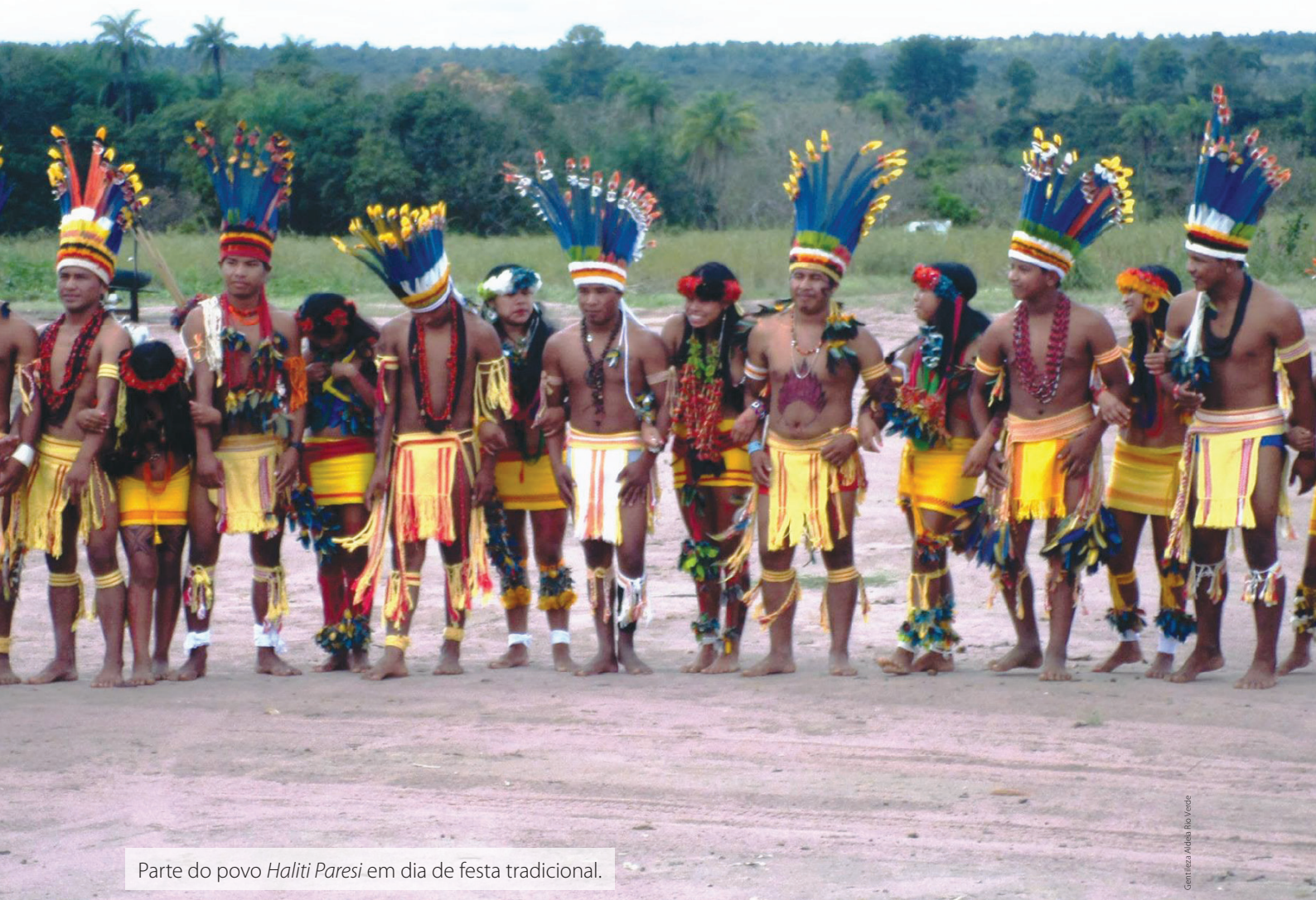
Parte do povo Haliti Paresi em dia de festa tradicional.

A Aldeia Rio Verde serve como ponto central para as outras aldeias do povo Paresi . Ali, existem mais recursos, em comparação com as outras aldeias, como