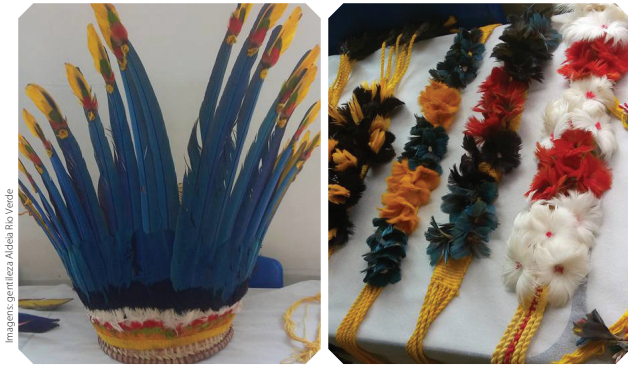
Artesanatos típicos da etnia Paresi .