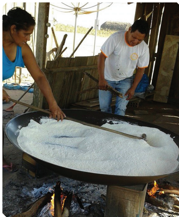
Preparação da farinha de mandioca.

Segundo Souza (1997), antigamente a base da alimentação Haliti Paresi era o peixe, o beiju e a caça, principalmente da ema ( awo ), do veado ( zotyare ) e do porco queixada ( hoze ), que tem para eles um valor espiritual. Hoje os alimentos tradicionais são: a mandioca, a batata, o milho, o feijão, as frutas (caju, cajuzinho, mangaba, pequi, bacava, buriti, pitomba, murici, melancia, abacaxi, jabuticaba e banana), a carne dos animais da região (seriema, veado, ema, porco queixada), além de ovos e leite, que também são bastante consumidos.