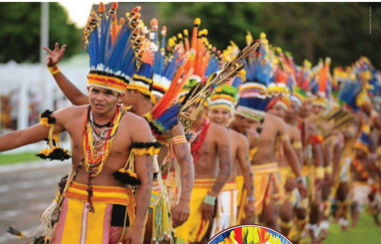
Homens trajados para apresentação tradicional.