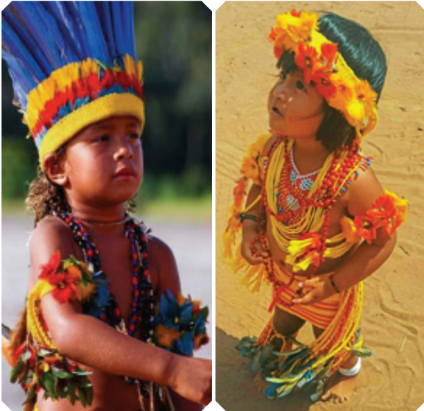
Crianças da etnia Haliti Paresi , da Aldeia Rio Verde, usando trajes típicos em dia de festa tradicional.

Atualmente, a quantidade de crianças que nascem é bem inferior à natalidade de tempos passados. Isso acontece também por razões financeiras, ou seja, não é tão fácil manter famílias com um grande número de pessoas.