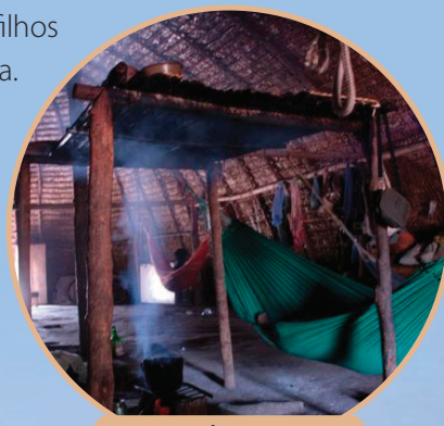
Interior de uma Hati.

A temperatura dentro dos casões é sempre bem agradável e, apesar de ser bem quente durante o dia, fica fresco lá dentro e à noite faz bastante frio. Sempre se acende uma pequena fogueira no interior da hati , à noite, para esquentar o local. Atualmente, em algumas aldeias existem casas feitas de alvenaria e de madeira. Geralmente os líderes com mais influência vivem nesses tipos de casa.