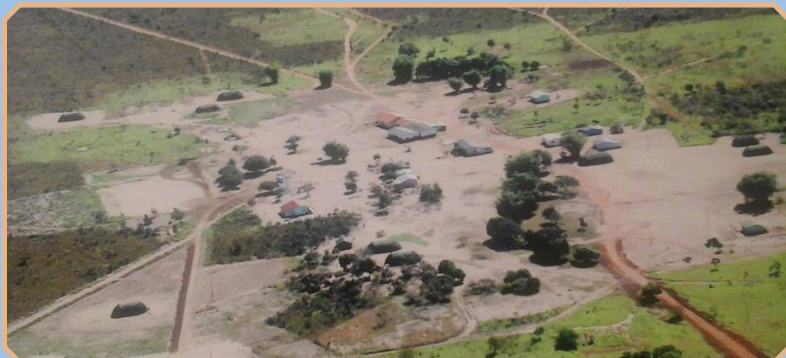
Parte do território indígena Pareci onde se localiza a Aldeia Rio Verde.