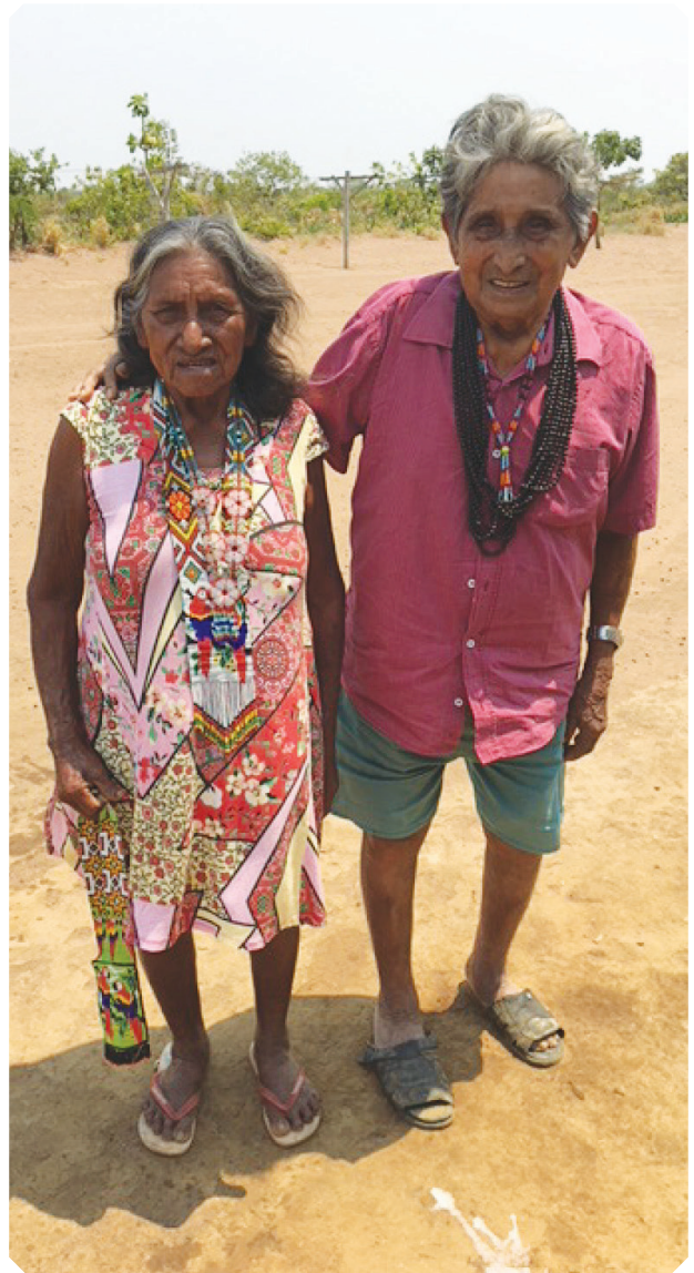
Casal de idosos da Aldeia Rio Verde, povo Haliti Paresi .