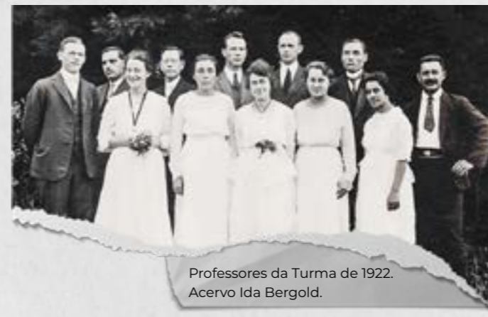
Professores da Turma de 1922.