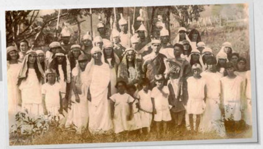
Participantes da dramatização da história do Rei Davi.

Na noite do dia 9, ocorreu a cerimônia de entrega dos diplomas. Cada formando fez um discurso sobre diferentes aspectos de sua trajetória no colégio e perspectivas futuras “rumo ao mar”, fazendo a diferença onde quer que fossem. Estavam então formados os primeiros obreiros adventistas brasileiros! Aos poucos, eles se multiplicariam e substituiriam os missionários estrangeiros na divulgação da mensagem adventista pelo Brasil.