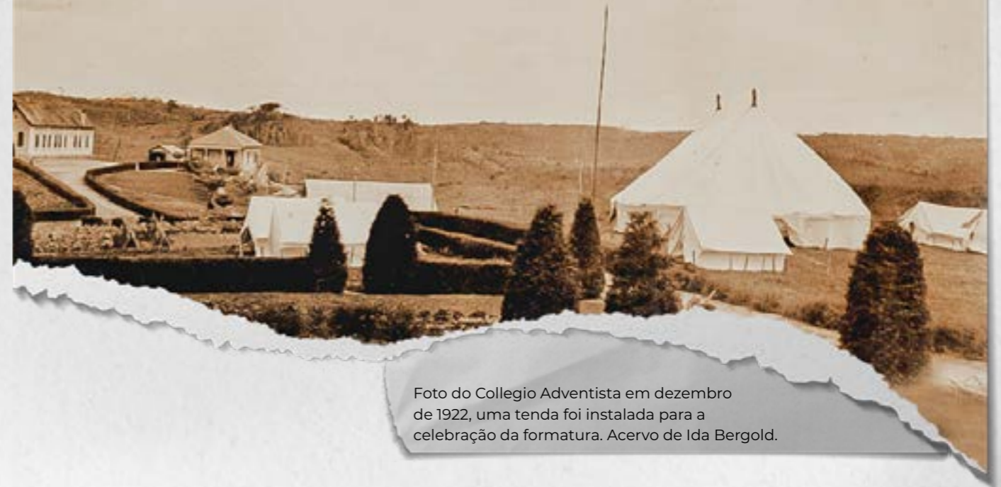
Foto do Colégio Adventista em dezembro de 1922, uma tenda foi instalada para a celebração da formatura. Acervo de Ida Bergold.

A ocasião da formatura foi dividida em 3 eventos que foram realizados num pavilhão de lona, armado onde hoje se encontra o prédio central. As comemorações tiveram início no dia 7 de dezembro de 1922, quando à noite houve a apresentação de uma dramatização da história do rei Davi. Na manhã do dia 9, no culto sabático, o Pastor Charles Thompson, então presidente da Divisão Sul-Americana, pregou sobre a grande comissão evangélica e animou os alunos a anunciar a mensagem a todo o mundo. No meio do sermão, um “pé de vento” fez a serragem que forrava o chão se levantar em forma de redemoinho.