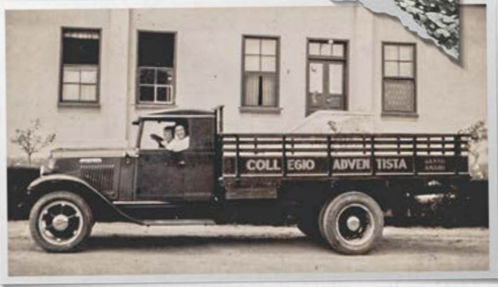
Um pequeno caminhão utilizado para o transporte de verduras e mercadorias produzidas no colégio para serem vendidos em Santo Amaro.