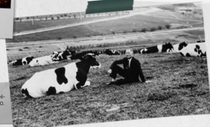
Adolpho com o gado holandês do Colégio Adventista Brasileiro nos anos 1940.