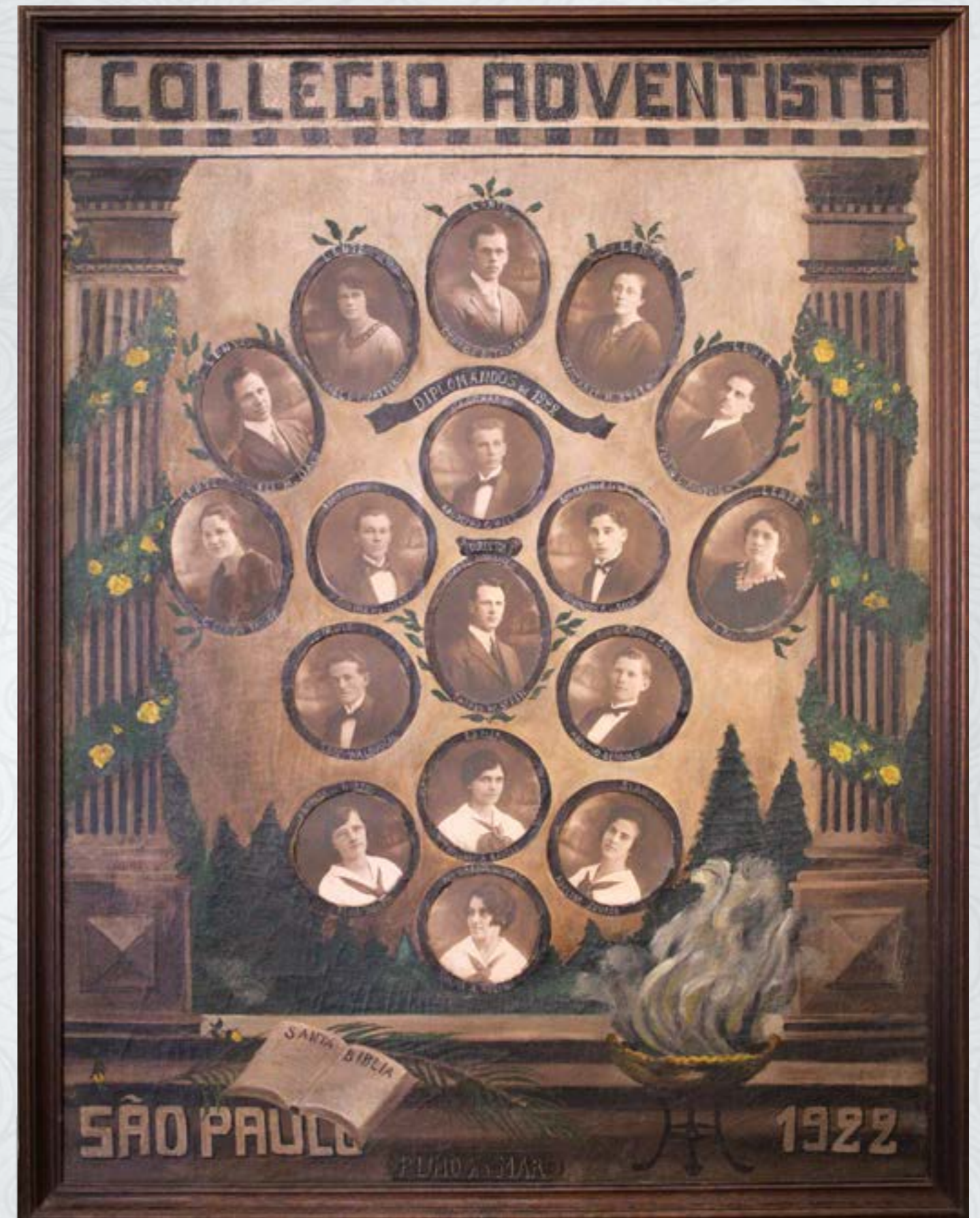
Quadro comemorativo feito por ocasião da formatura.